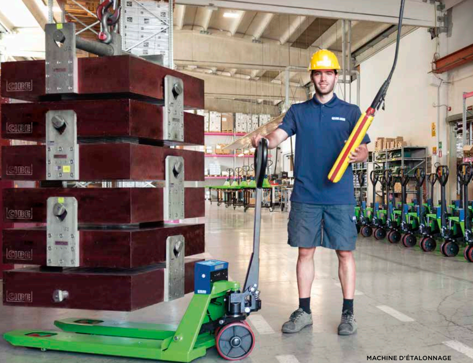
MACHINE D'ÉTALONNAGE DES TRANSPALETTES PESEURS DINI ARGO